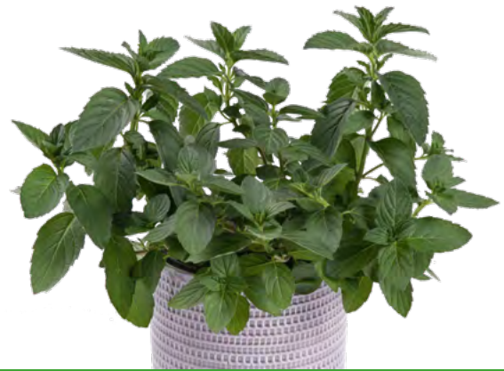
M. arvensis (Japan. Heilminze) 73393