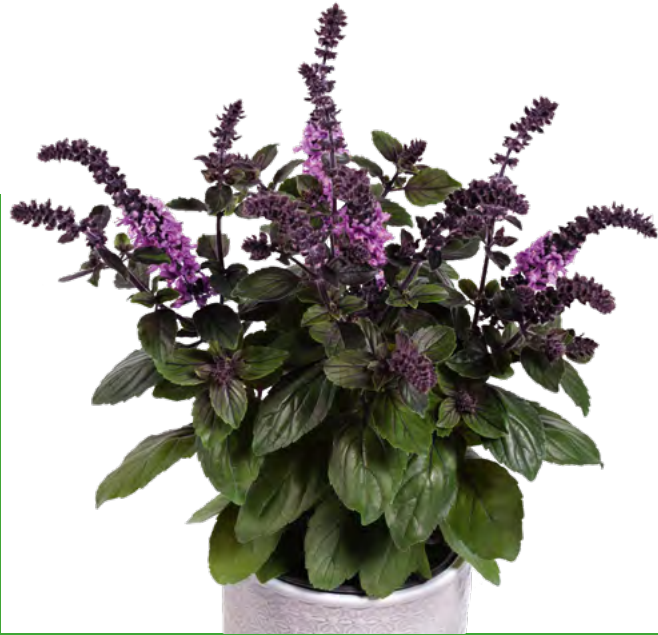
Ocimum x hybrida ‚Blue‘ 73541