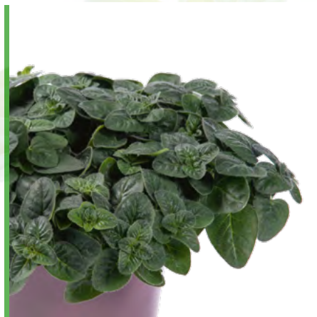
Origanum vulgare (Wilder Oregano) 73441