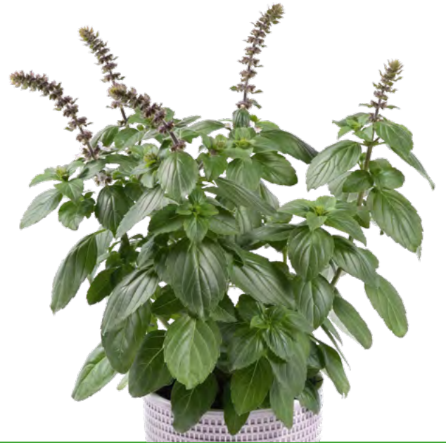
Ocimum x hybrida ‚White‘ 73542