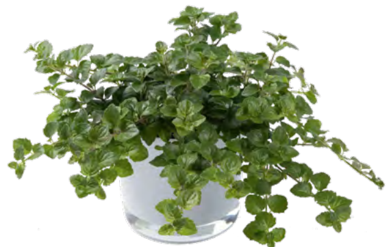
Satureja douglasii 'Indian Mint' 73337