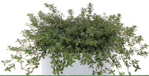
Thymus praecox 73493