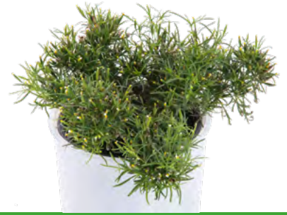
Tagetes filifolia 73564