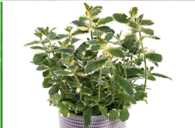
M. suaveolens (Ananasminze) 73417