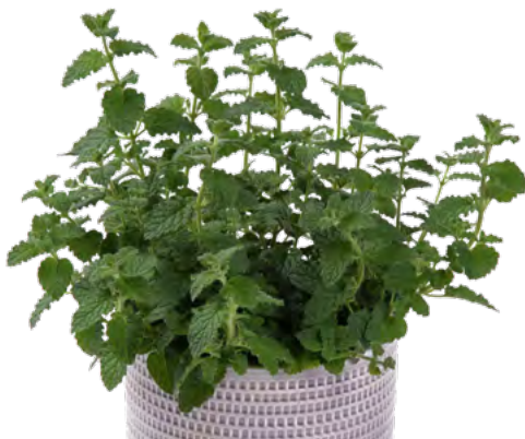
M. species (Erdbeermintze) 73438