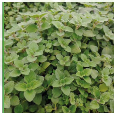
Origanum vulgare 'Hot' 73448