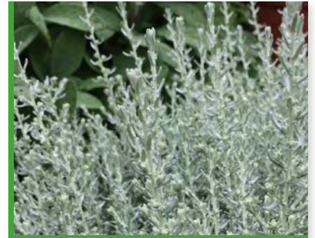
Helichrysum italicum kompakt 73412