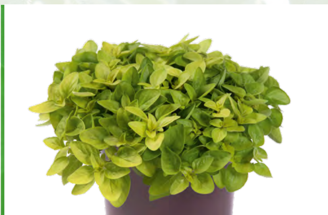
Origanum vulgare 'Gold' 73537