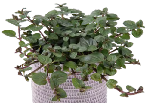
M. x piperita f citrata 'After Eight' 73434