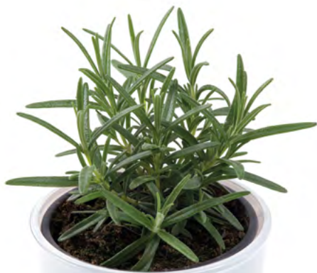
R. officinalis (Echter Rosmarin) 73451