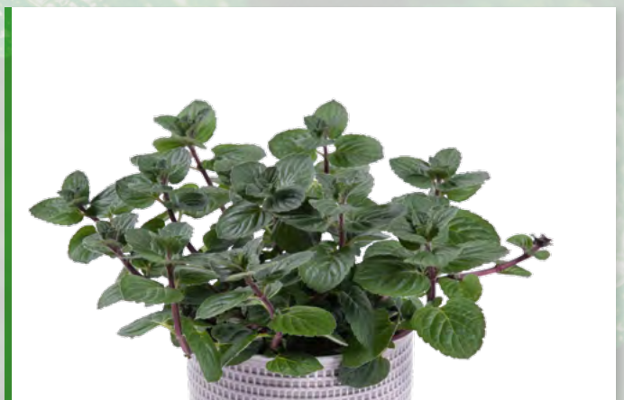
M. x piperita 'Ella' 73391