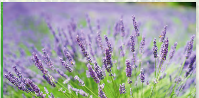
Lavandula x intermedia 'Grosso' 53211