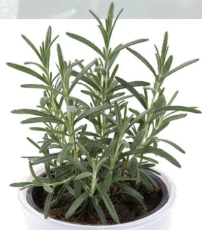
R. officinalis (Winterharter Rosmarin) 73546