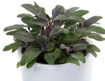
S. officinalis 'Purpurascens' 73506