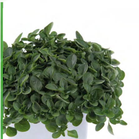
Origanum vulgare (Hängender Oregano) 73536