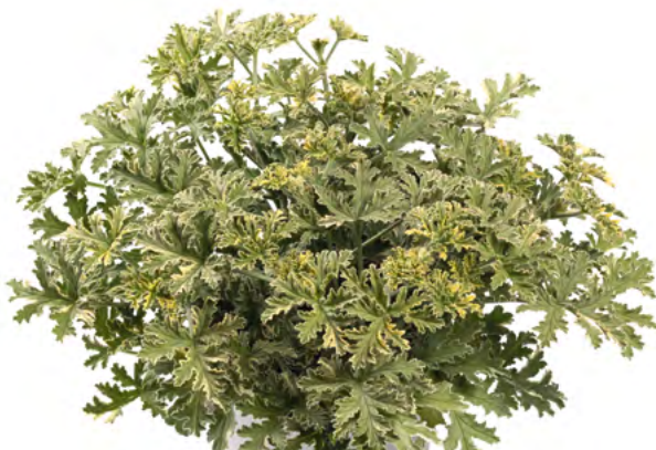
Lady Plymouth 14001