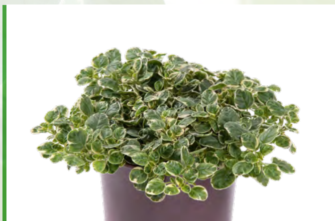
Origanum vulgare variegata 73442