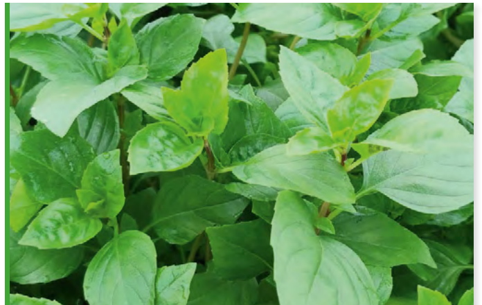
Ocimum x basilicum 73404