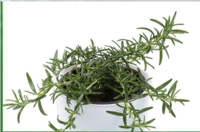
R. officinalis 'Corsican Blue' 73452