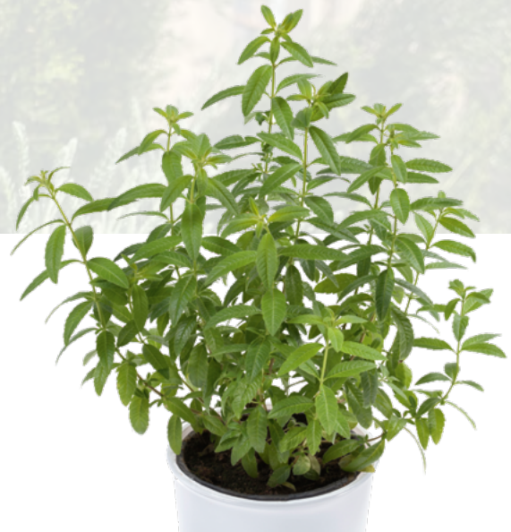
Aloysia citriodora 73403