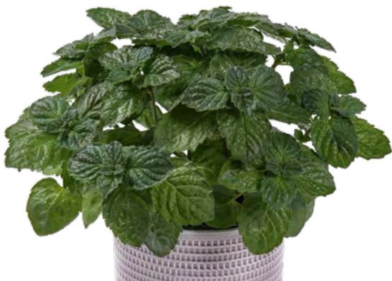
M. x piperita f citrata (Grapefruitminze) 73436