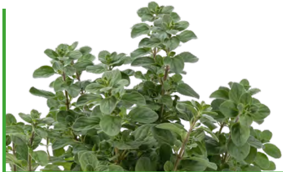
Majorana hortensis 73389