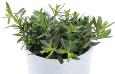
Artemisia dracunculoides 73401