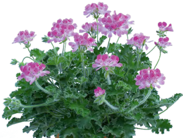
Pink Capitatum 14007