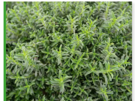
Satureja montana 73407