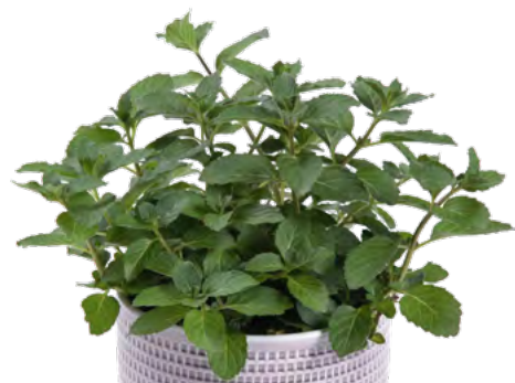
M. spicata (Spearmint) 73395