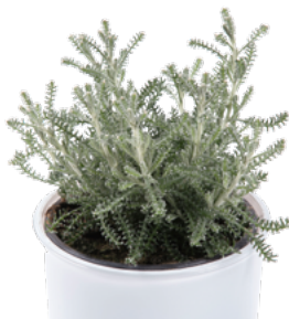
Santolina chamaecyparissus 73406