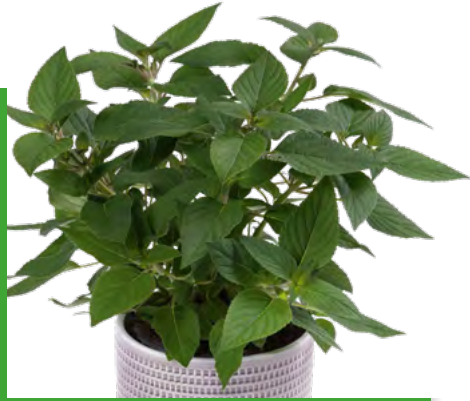
S. rutilans 73462