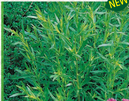
Artemisia dracunculoides 'Frz. Estragon Strong' 73362