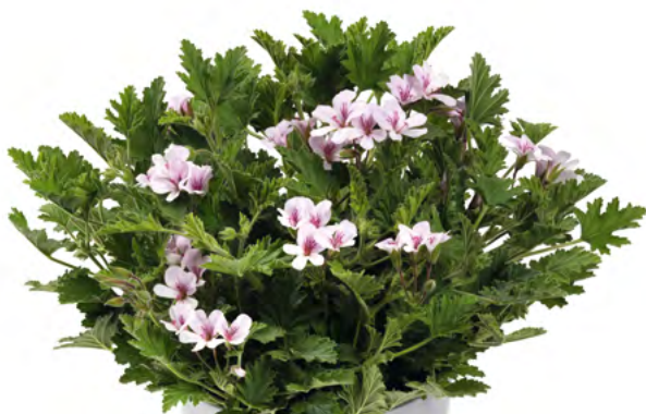
Pelargonium citriodorum 14011