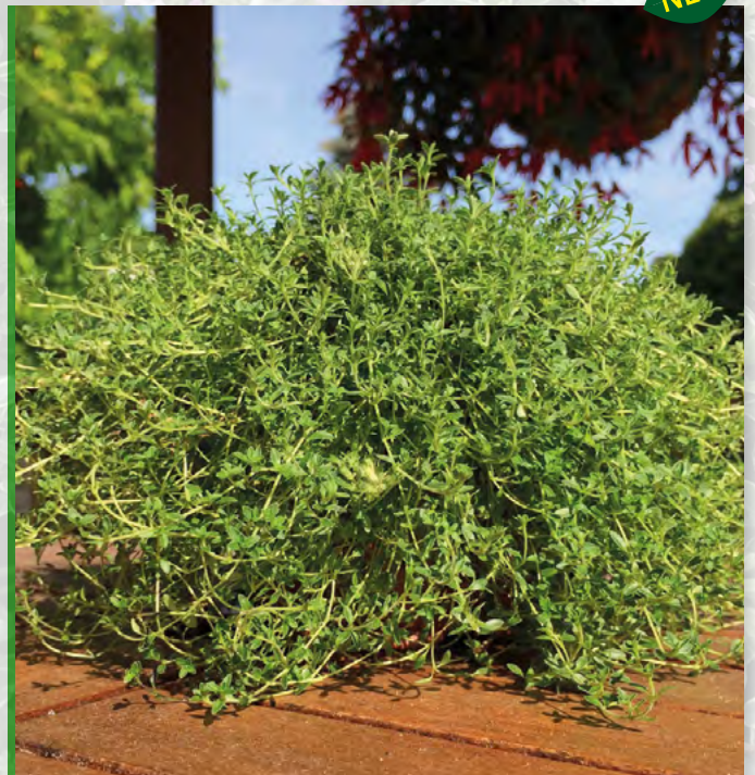
Thymus citriodorus 'Orange' 73490