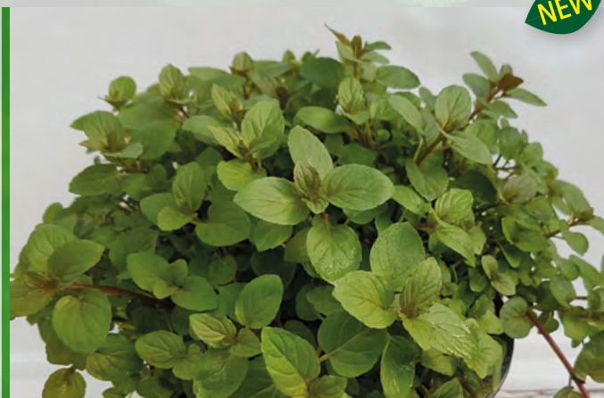
M. x piperita 'Black Mitcham' 73363