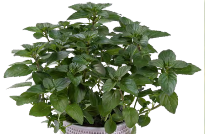
M. x piperita f citrata (Zitronenminze) 73428