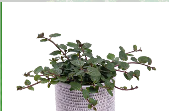
M. x piperita (Pfefferminze) 73422