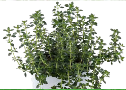
Thymus citriodorus 'Lemon' 73481