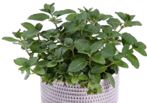
M. x piperita f citrata (Schweizer M.) 73392