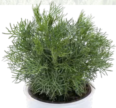
Artemisia alba 73416