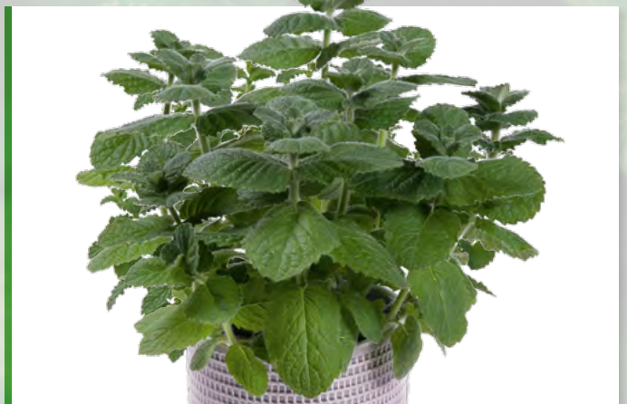
M. suaveolens (Apfelminze) 73425