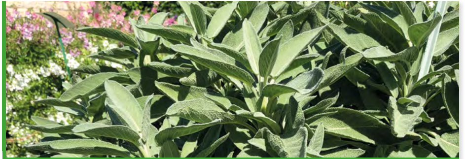
S. officinalis 'GardenZest IntenseSage' 20146