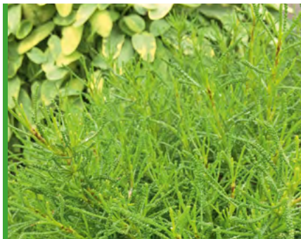
Santolina viridis 73510