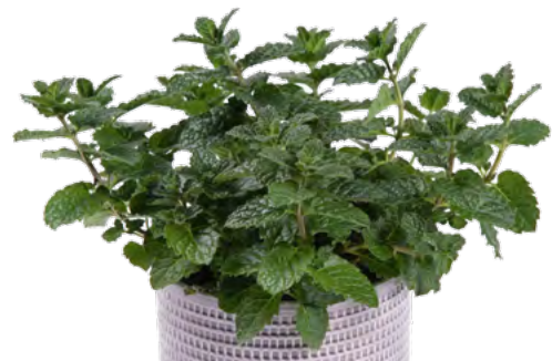
M. spicata (Hugo-Mintze) 73418