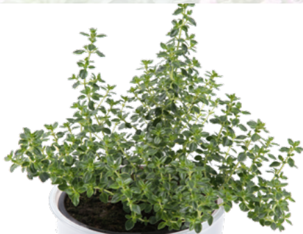
Thymus citriodorus variegata 'Gold' 73485