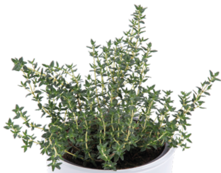
Thymus vulgaris 'Faustinoi' 73483