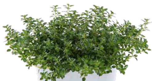
Thymus pulegioides 73496