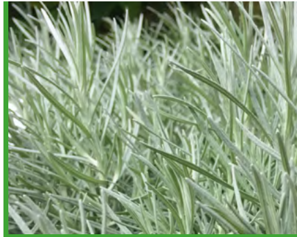
Helichrysum italicum 'Tall' 73242