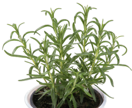
R. officinalis 'Maresme Impr.' 73453