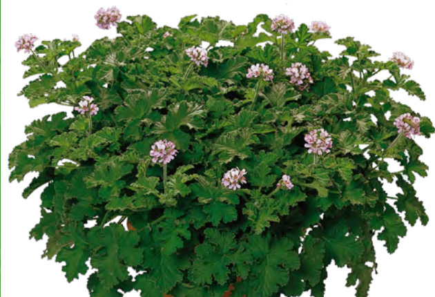
Attar of Roses 14006