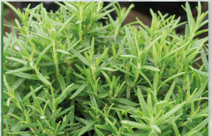
R. officinalis 'Perigord' 73454