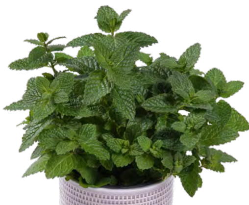
M. spicata (Marokkan. Minze) 73426