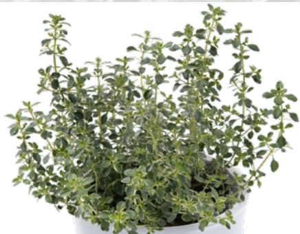
Thymus citriodorus variegata 'Silver Queen' 73488