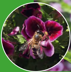
Angels Perfume 14002

Die Blätter der Duftpelargonien geben Getränken und süßen wie herzhaften Speisen eine besondere Note, mit den Blüten kann man Gerichte wunderbar dekorieren.