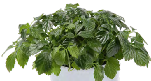
Gynostemma pentaphyllum 73402