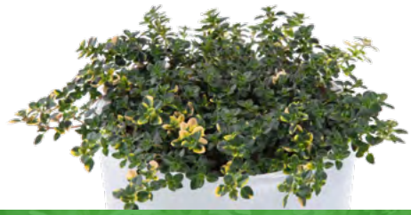
Thymus citriodorus 'Doone Valley' 73489