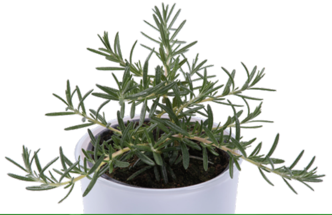
R. officinalis (Hängender Rosmarin) 73547