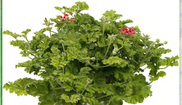
Concolor Lace 14010