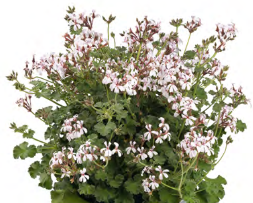
Pelargonium fragrans 14003