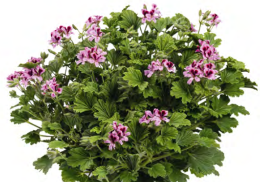
Orange Fizz 14012