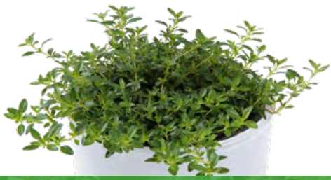
Thymus citriodorus 'Aureus' 73486