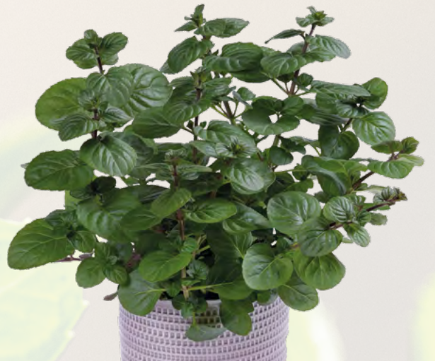
M. x piperita f citrata (Mandarinminze) 73437