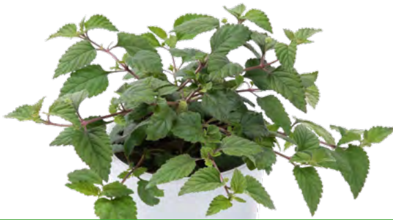
Lippia dulcis 73381