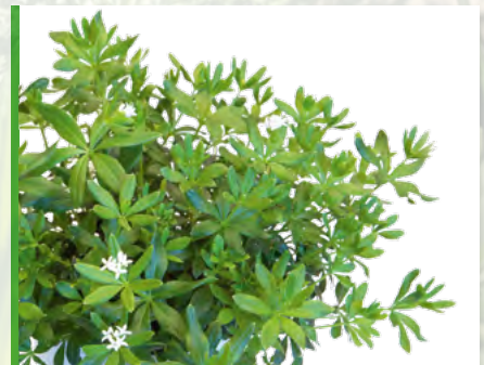
Galium odoratum 73225