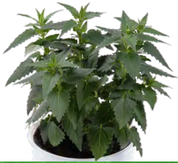
Agastache mexicana 73388