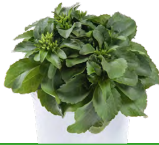
Stevia rebaudiana 73408