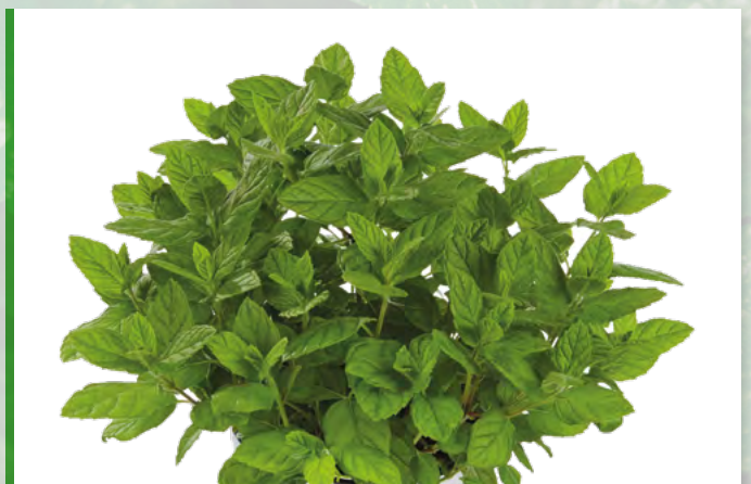
M. x piperita (Feine Englische Minze) 73390