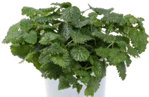
Melissa officinalis 73384