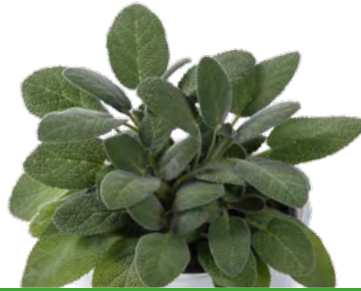
S. officinalis 'Berggarten Blau' 73503