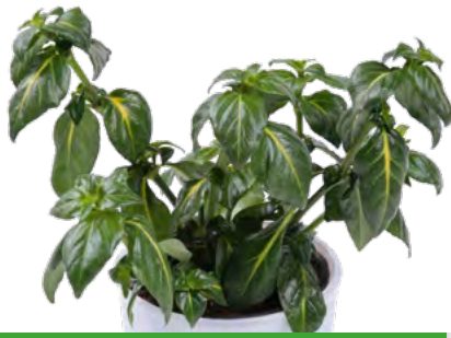
Rungia klossii 73548