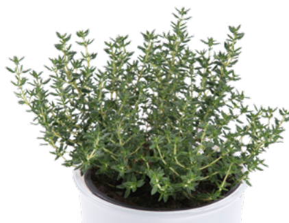
Thymus vulgaris 'Freddy' 73482