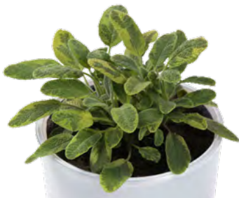
S. officinalis 'Icterina' 73505