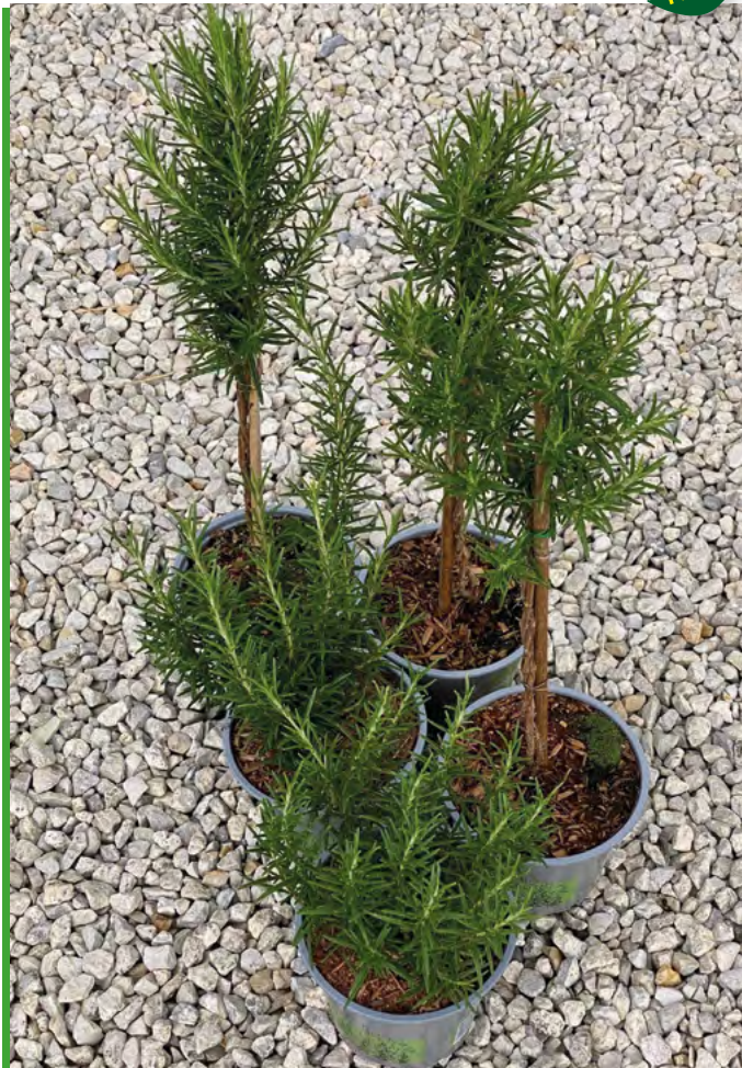
R. officinalis 'Sardinia' 73257