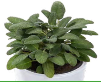
S. officinalis 'Grower's Choice' 73504