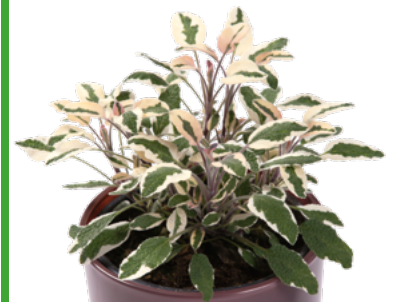
S. officinalis 'Tricolor' 73508