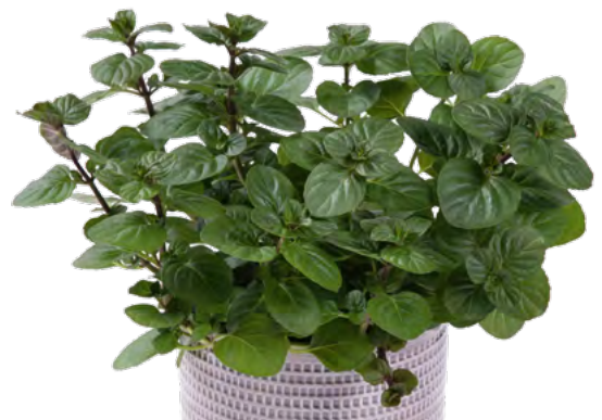
M. x piperita f citrata 'Orange' 73435