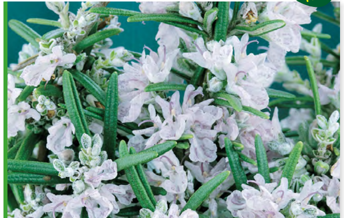
R. officinalis 'Britania' 73565

Buschige Rosmarin erhält man bei einer Kultur über den Winter. Die mittelstarken Sorten eignen sich auch für die Frühjahrskultur.